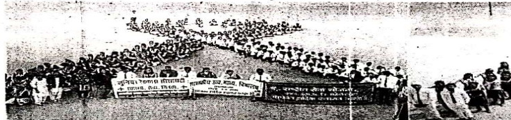
जिलेभर स्कूलों में एड्स दिवस पर विभिन्न विभागों के सहयोग पर विभिन्न कार्यक्रम आयोजित किए गए।

2018 में विश्व एड्स दिवस के लिए थीम 'एड्स से सुरक्षित रहना' थी। गत वर्ष के दौरान भारत में एड्स का प्रसारण में विभिन्न गतिविधियों के माध्यम से प्रचार-प्रसार किया गया। 17 नवंबर को रैड रिबन कला के माध्यम से स्वयंसेवकों की समुदायकरण किया गया। इससे स्वस्थ और स्वस्थ रहने पर विशेष बल दिया गया।